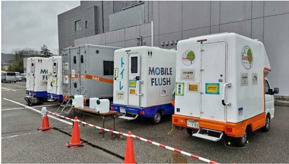
①トイレカー (志賀町 富来活性化センター)

ONEXCO中日本・東日本・西日本は、志賀町・輪島市・珠洲市に トイレカーおよび給水車を計40台派遣 しています。