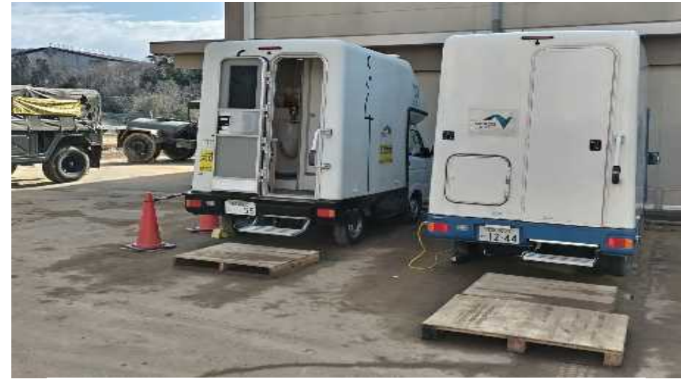
②トイレカー(NEXCO東日本・中日本・西日本車両) (輪島市 輪島中学校)