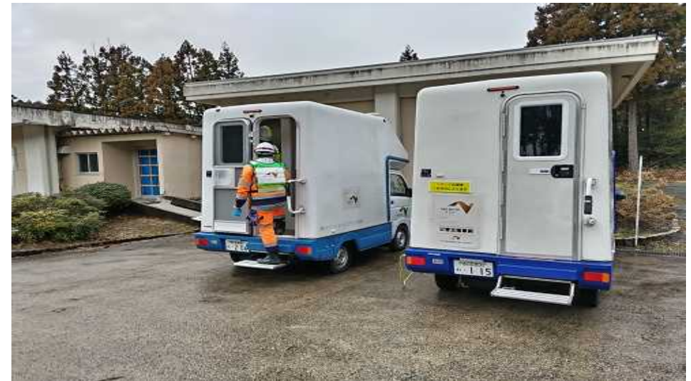
④トイレカー(NEXCO東日本・中日本車両) (珠洲市 珠洲市営斎場)