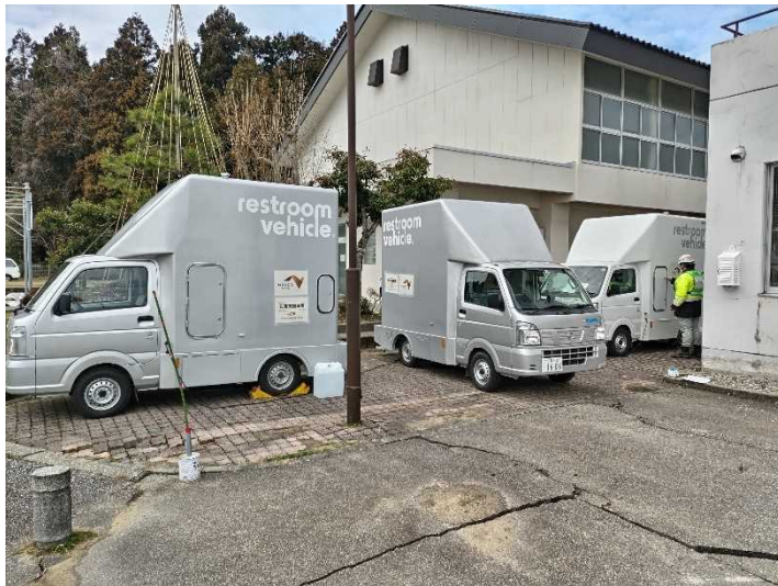
③トイレカー (珠洲市 みさき小学校)