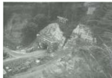
▲当時の建設工事様子