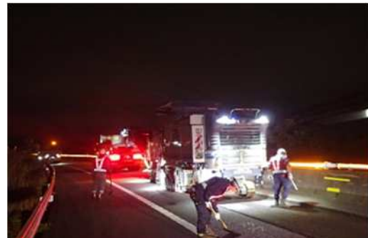
舗装補修工事 作業状況