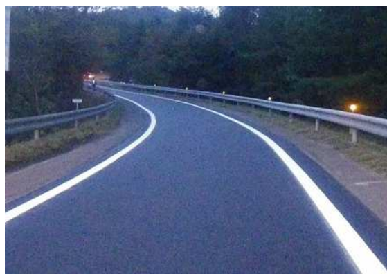
舗装補修後(イメージ)