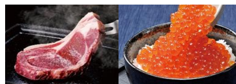
※写真は全てイメージです

・500名さま分の賞品をご用意! 好みや気分に合わせて選べるカタログギフトも3コースをご用意しました。