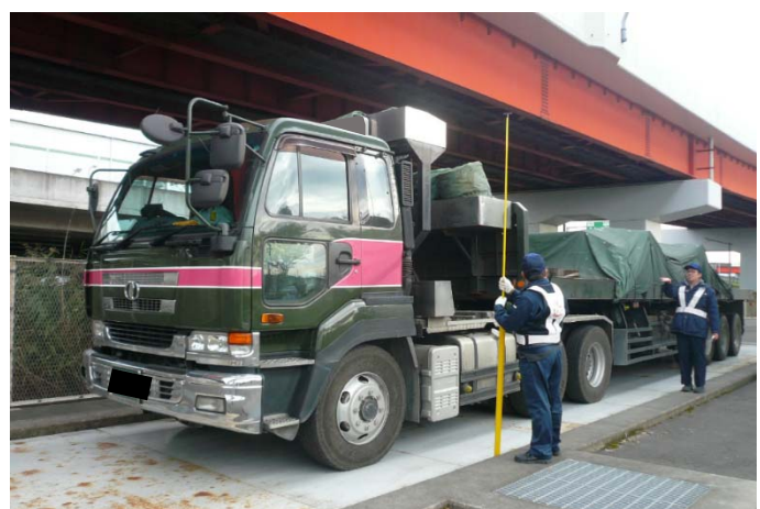
⑥【三郷地区車両取締基地】