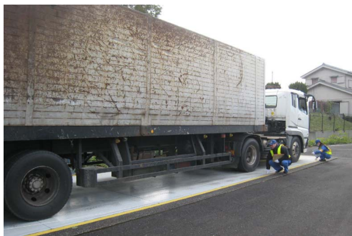
⑤【狭山特殊車両基地】