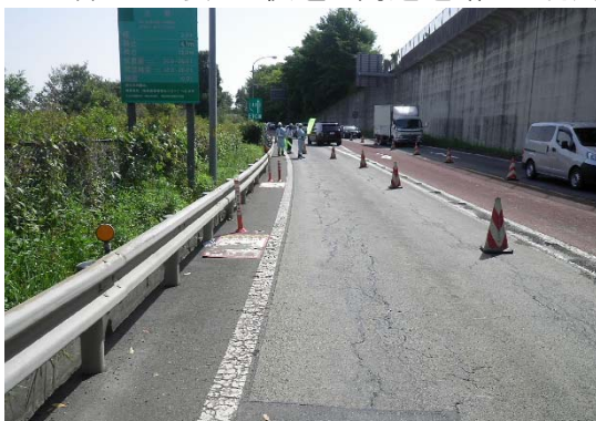
青梅IC 現況舗装状況

お客さまに安全・快適に高速道路をご利用いただくため、ご理解とご協力をお願いします。