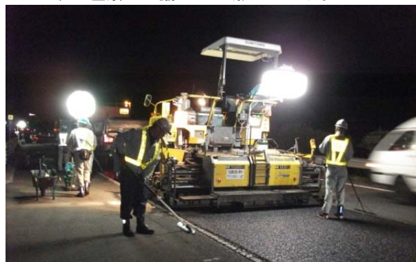
夜間舗設作業状況