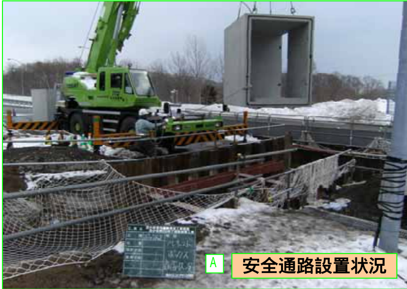
安全通路設置状況