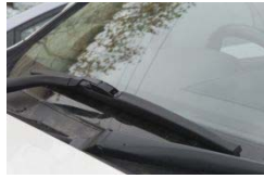
冬ワイパーチェック