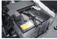
バッテリーチェック