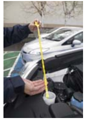
冬用ウォッシャー液チェック