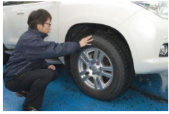
冬タイヤチェック

初冬の11月から事故が増えます。とくにトンネルの出入口や橋の上などは凍結しやすいので注意が必要です。早めの冬装備で安心に走行できます。