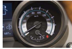
ガソリンチェック