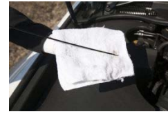
オイル量チェック