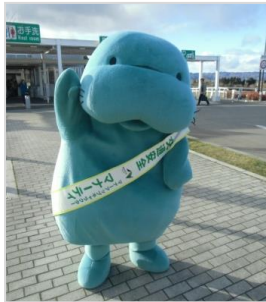
当社マナーアップキャラクター「マナーティ」もキャンペーンに参加します。

道東エリアでは、現在も通行止めが続く国道274号の代替路である道東道の交通を死守すべく、音更帯広IC・十勝平原SA・占冠PAの3箇所では北海道十勝総合振興局、占冠村、「とかち青空レディ」と協力し、安全運転を訴えかけます。