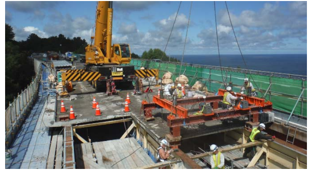
【既設床版の撤去状況】