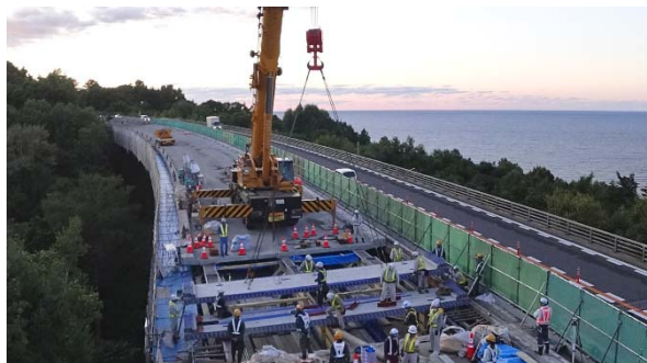
【新設床版の設置状況】