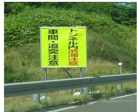
トンネル手前での渋滞注意喚起看板