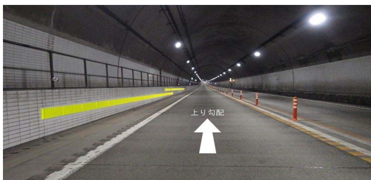
トンネル内の水平ライン

道東自動車道のトンネル内の側壁に黄色の反射材を水平に設置することで、視覚的に上り勾配であることをお知らせし、無意識のうちに発生する速度低下を防ぎます。