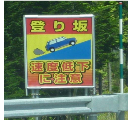
登り坂での速度低下注意喚起看板