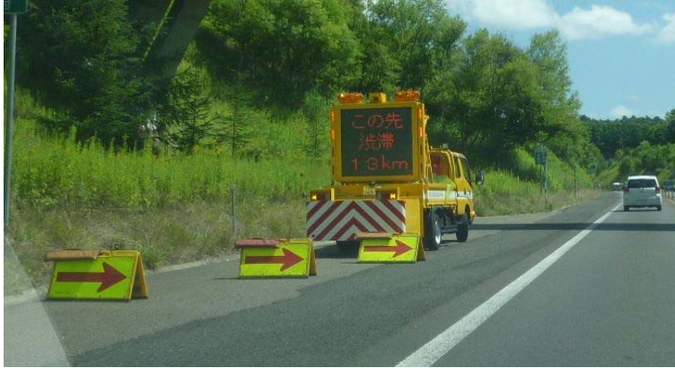
標識車による渋滞情報の提供