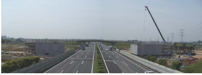
[写真位置①]工事箇所の最新状況 (跨高速道路橋上から東京方面を望む)