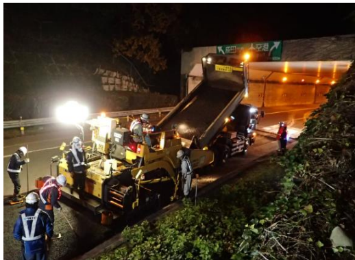
構造物部の段差修正

舗装の沈下により段差が発生した箇所の補修を行い、走行性・安全性の向上を図ります。