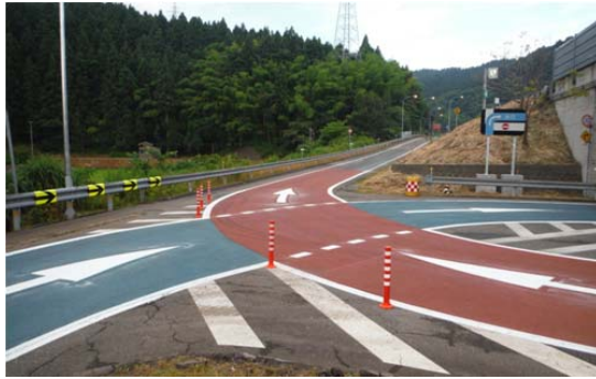
平面交差のICにおける逆走対策工事