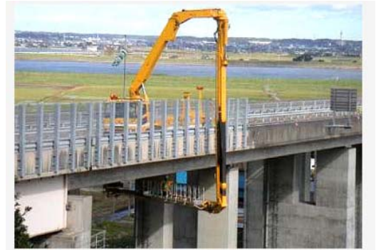
大型橋梁点検車による近接目視点検