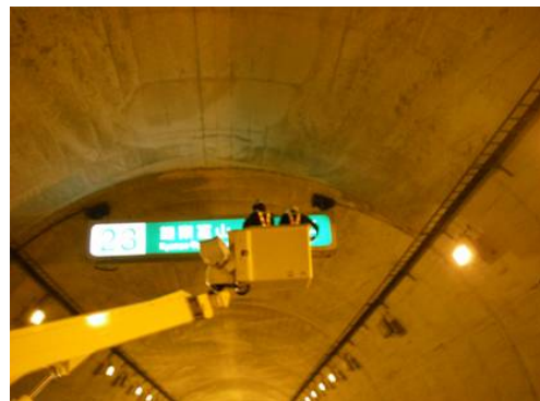
トンネル内構造物の点検・清掃