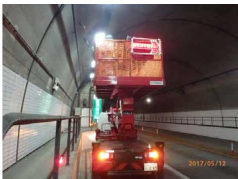
ラジオ再放送誘導線の清掃

お客さまに安全・快適に高速道路をご利用いただくため、ご理解とご協力をお願いします。