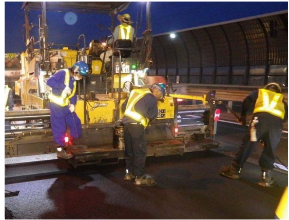
写真-2 アスファルト舗装施工状況