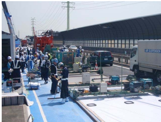
写真-1 鋼繊維補強コンクリート施工状況