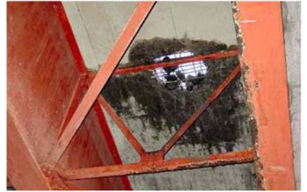
<上図：橋（床版）損傷の例>

大型車通行適正化に向けた関東地域連絡協議会（以下、「連絡協議会」という。）は、連絡協議会を構成する道路管理者が中心となり、一都三県の警察など構成団体との連携拡大を実現し、道路法・道路交通法・道路運送車両法による 3 法同時合同取締を実施しましたので、お知らせします。