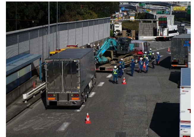
⑥【首都高速道路(株)】大井本線料金所