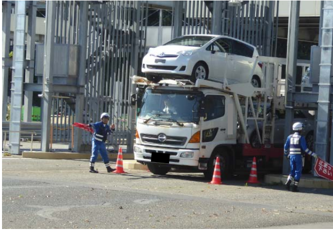
①【中日本高速道路(株)】八王子料金所