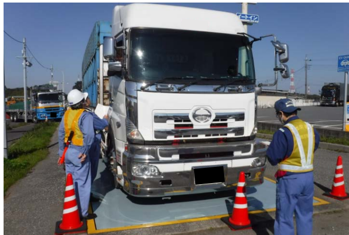
⑤【千葉国道事務所】八千代車両取締基地