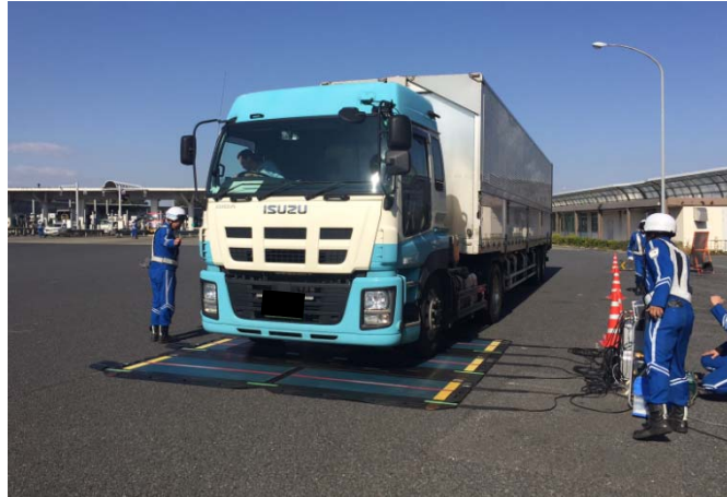
②【東日本高速道路(株)】新座本線料金所