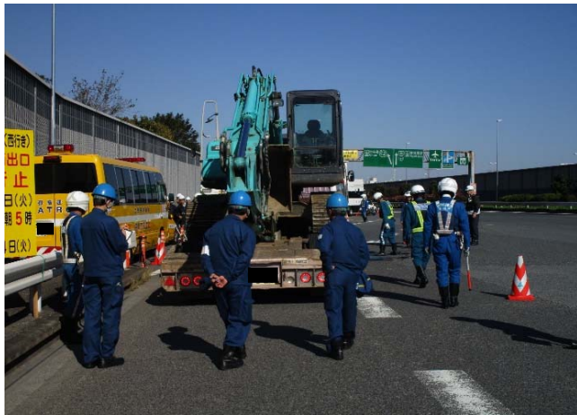
④【首都高速道路(株)/東京運輸支局】大井本線料金所