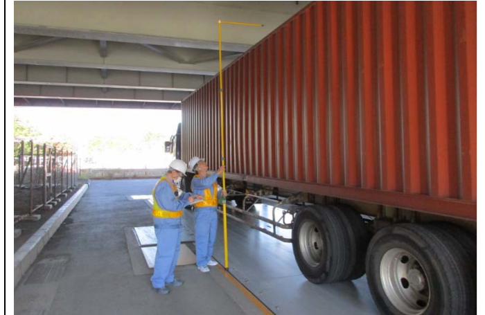
③【東京国道事務所】辰巳車両取締基地