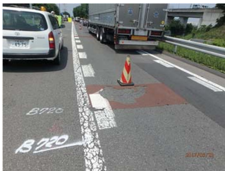
鶴ヶ島 JCT 現況舗装状況

お客さまに安全・快適に高速道路をご利用いただくため、ご理解とご協力をお願いします。