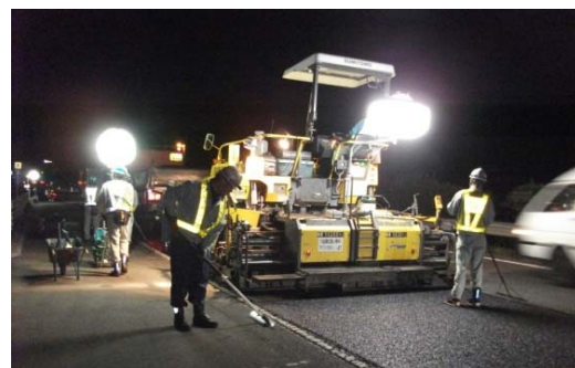
夜間舗設作業状況