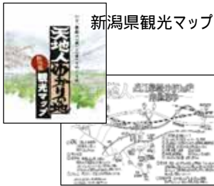
エリアコンシェルジェの手作りマップ

高速道路のサービスエリア内に新潟県の観光情報コーナーを設置し、県内の観光地を紹介したガイドブックや観光マップなどにより観光情報を提供しています。(越後川口SA、米山SA) また、エリアコンシェルジェの手作りマップも作製・配布しています。(越後川口SA、黒埼PA) 天地人ポスターを主なSA・PAに掲出しています。