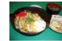
「戦国鍋丼」 関越道 山谷PA上り

新潟県内の高速道路のSA・PAでは、お客さまに楽しんでいただくため、地元の食材を使用し、直江兼続公や上杉謙信公にちなんだネーミングの天地人メニューを販売しています。