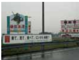
「大観光交流年」の横断幕

新潟県内の主な料金所において、「天地人」、「2009新潟県大観光交流年」などの懸垂幕・横断幕を設置し、お客さまをお迎えするとともに観光機運の醸成に努めています。