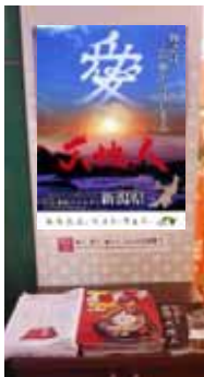
観光情報コーナー