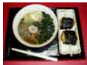
「天地人 青苧そばセット」 北陸道 栄PA下り

新潟県内の主な料金所において、「天地人」、「2009新潟県大観光交流年」などの懸垂幕・横断幕を設置し、お客さまをお迎えするとともに観光機運の醸成に努めています。