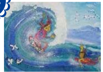
「サーフィンのチャンピオンになった夢」 新井小学校 5年

主催：NEXCO東日本 信越工事事務所 後援：新潟県上越市、妙高市、長野県上水内郡信濃町 協力：(株)上越シビックサービス