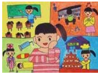
「広がるわたしのゆめ」 美守小学校 3年

優秀作品4点は原画をパネル加工し、 上信越道 妙高SA(上り線)2階展示室 「ハイウェイ未来館」に展示します。