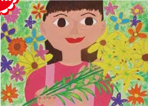
「私のゆめはお花屋さん」 大手町小学校 4年