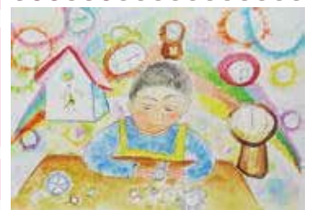
「とけいやさんになりたいな」 春日新田小学校 2年