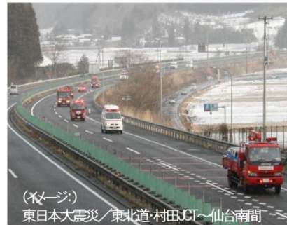
緊急車両の高速道路における円滑な通行