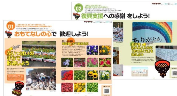
花いっぱい運動等