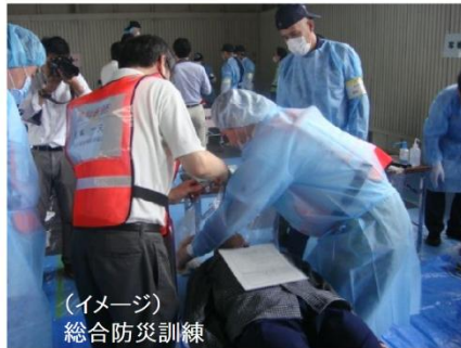
関係機関と連携した災害対応訓練の実施