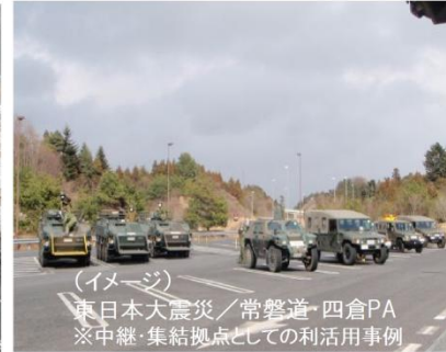
防災拠点としてのSA・PAの利活用