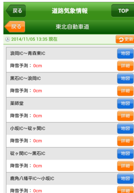
道路気象情報画面