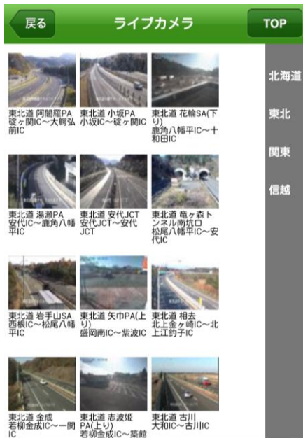
ライブカメラ画面