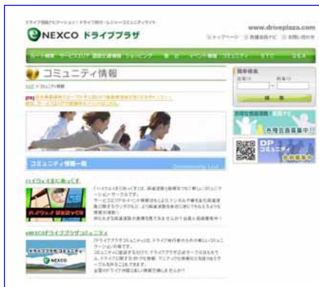
[ 図3 ドライブプラザ・コミュニティ イメージ ]

誰もが自由にメッセージを書き込むことのできるコミュニケーション機能を用い、 ユーザーの口コミ情報を集め、それをサイト内で閲覧し意見交換することができるサービスを提供 します。コミュニケーション機能には、株式会社エイベック研究所が提供するコミュニティマーケティング・ツール『サークルプレイヤー』を採用しています。