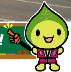
はいえい人街ネット イメージキャラクター 『みちのこはっぴ〜くん』