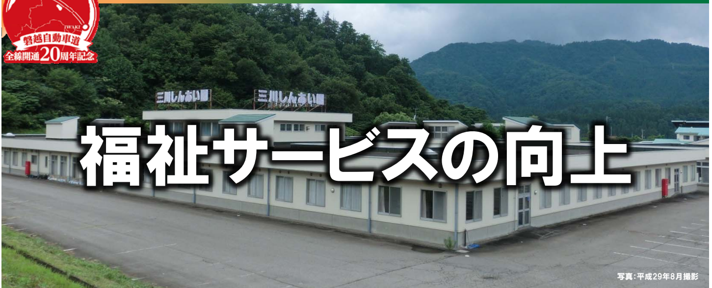
写真：平成29年8月撮影