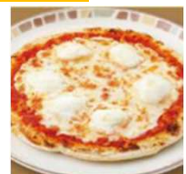
マルゲリータピザ