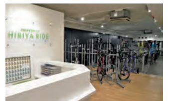
更衣室、シャワールームを備えた「HIBIYA RIDE」