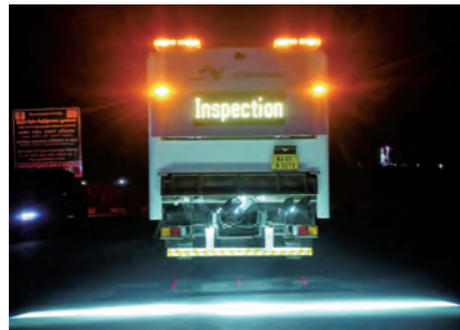
路面性状測定車「E-NEXCO Eye」の測定状況