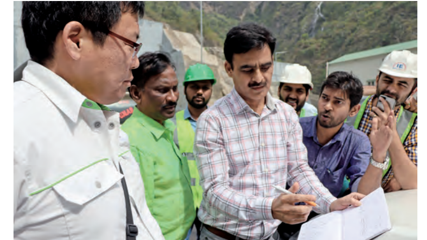
インドでの技術指導の様子

当社が長年培った高速道路事業の技術やノウハウを活用して開発途上国を対象にコンサルティング業務を実施しています。現地省庁への技術協力を目的として、インドではレジリエントな山岳道路開発のための能力向上プロジェクトを、バングラデシュでは国道の運営・維持管理の技術支援を行っています。また、道路事業者の立場として、ITS設備や施設に係る運用や維持管理に関する現地調査等を行っています。