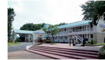
E-NEXCO LODGE 佐野SA店 (東北道 佐野SA)

高速道路から降りることなく宿泊が可能な[E-NEXCO LODGE]を東北道のSA2カ所(佐野SA、長者原SA上り線)で展開し、高速道路の利便性向上につなげています。