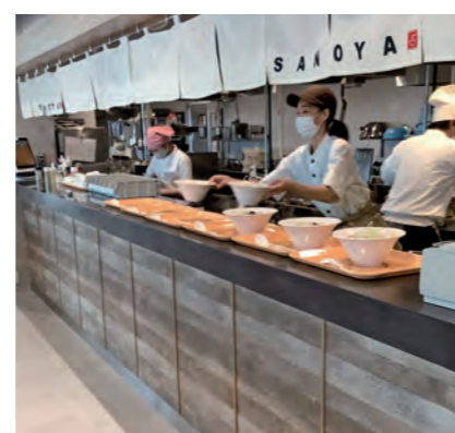
地域のグルメを販売(東北道 佐野SA下り線)