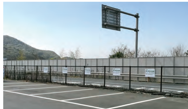
SA・PA一般道側駐車場(東北道 佐野SA下り線)