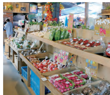
地域の野菜産品を販売(関越道 赤城高原SA上り線)