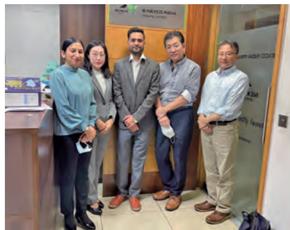
ENIは、現在、日本人駐在員2名、インド人スタッフ3名の体制で運営