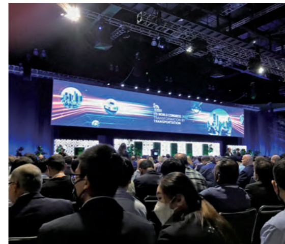
ITS世界会議(ロサンゼルス)参加

当社と技術協力協定を締結しているオーストリアの高速道路会社 ASFINAG社および各国の関係道路機関を訪問し、現場視察や道路技術について意見交換を行っています。