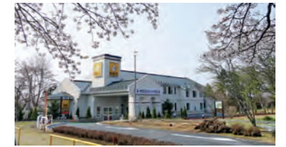
E-NEXCO LODGE 長者原SA店 (東北道 長者原SA上り線)