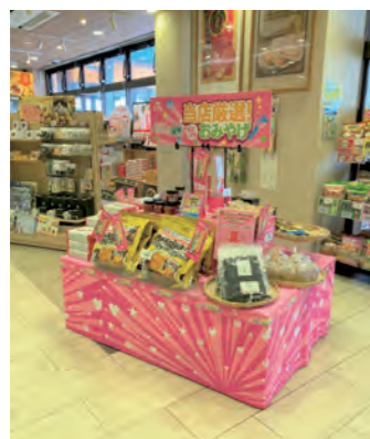
地域のお土産をPRするフェア(関越道 越後川口SA下り線)