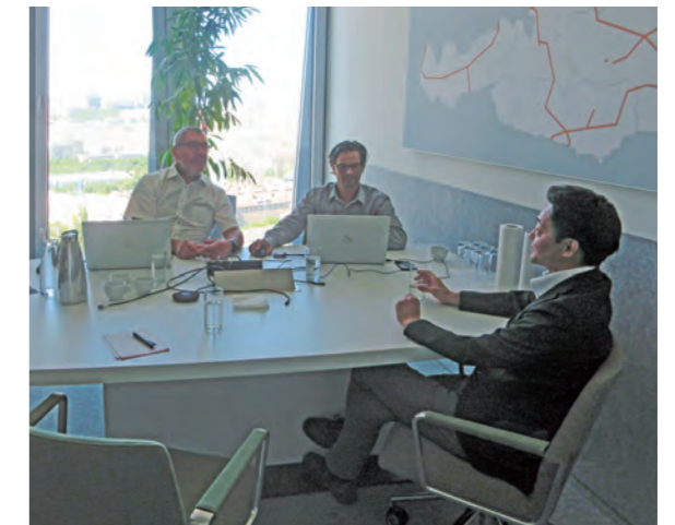
ASFINAG本社との意見交換