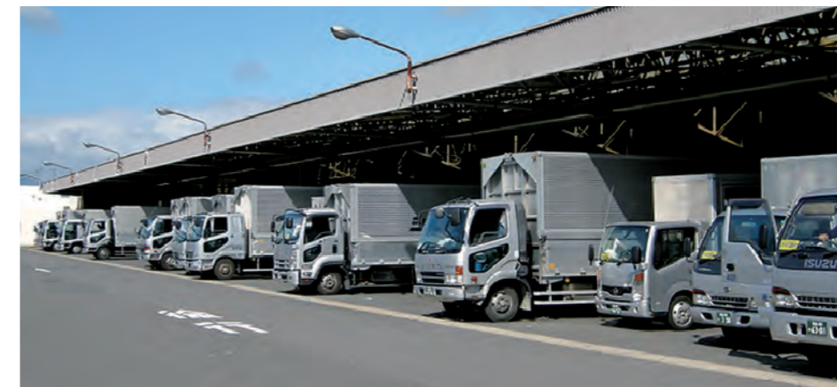
郡山トラックターミナル(東北道 郡山IC付近)

駐輪台数は約120台を誇り、男女別の更衣室やシャワーブース12基も備え、自転車ライフをサポートしています。