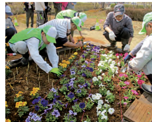
高福連携活動(花壇整備の様子)

高速道路と福祉が連携して幸福を上げていく「高福連携」は、高速道路の環境美化作業などを障がいのある方と協働し、地域社会の活性化に貢献することを目指した取り組みです。