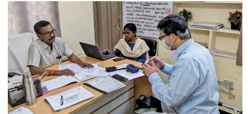
JICA専門家による関係機関との打ち合わせ

また、国土交通省やJICAからの依頼で、開発途上国の技術者を受け入れ、研修を行っています。