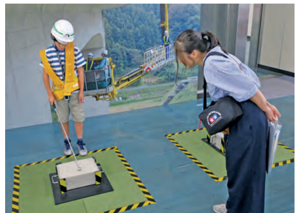
教育イベントでのコンクリート点検作業体験の様子

小中学校の生徒に向けたキャリア教育用の副教材（おしごと年鑑）や高速道路の今と未来を一緒に考え、高速道路を通じた地域社会の発展と暮らしを考えてもらうボーイスカウトの取組み（ハイウェイナビゲーター）に協賛しています。