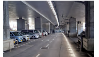
東北道高架下(さいたま市岩槻区)