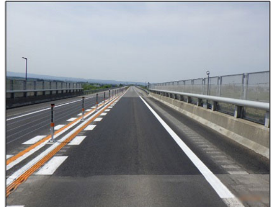
舗装補修後イメージ