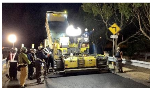
舗装補修工事 作業状況