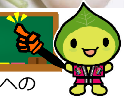
はいうえい人街ネット イメージキャラクター 『みちのこはっぴ〜くん』