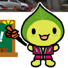
はいえい人街ネット イメージキャラクター 『みちのこはっぴ〜くん』