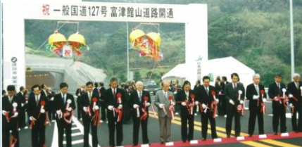
富津竹岡IC～鋸南富山IC開通