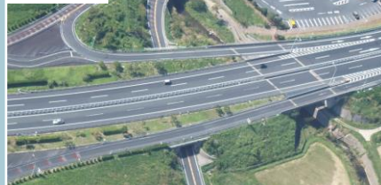
ハイウェイアス富楽里付近 付加車線設置