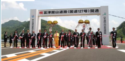
鋸南富山IC～富浦IC開通