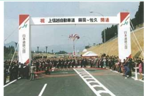
藤岡～佐久間開通(平成5年3月)

E18上信越自動車道は、E17関越自動車道 藤岡JCTから群馬県南部、長野県北部、新潟県西部を経て上越JCTでE8北陸自動車道へ接続する高速道路で、地域の産業、経済、文化、観光などの発展に大きく寄与しています。令和元年10月に全線開通から20周年を迎えました。