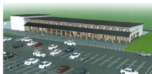
拡張事業(農業振興施設)のイメージ