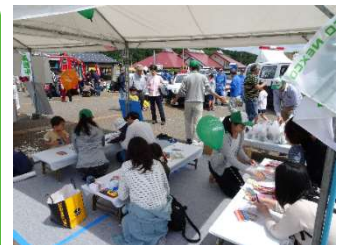
道の駅におけるイベント

道の駅あらいは新潟県の人気スポットの中でも 来場者数が8年連続で県内1位 ！国道18号からだけでなく、上信越道の上下線からも利用可能です。高速道路からの出入りはスマートICを利用してさらに快適にご利用いただけます！