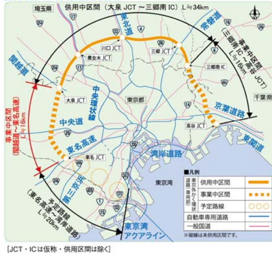
全体計画と幹線道路網図