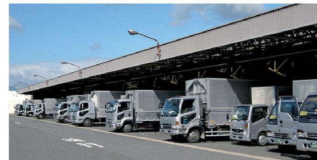
郡山トラックターミナル（東北道 郡山IC付近）

高速道路の高架下を駐車場等として利用いただくことで、周辺地域における生活や企業活動に貢献しています。