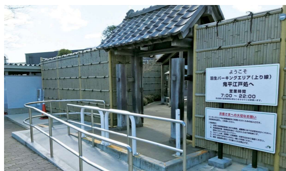
ウォークインゲート（東北道 羽生PA上り線）

地域の名産品や地元で生産された青果類を幅広く取り揃え、SA・PAで販売しています。また、地域の皆さまがイベントを実施する場としてもSA・PAを有効に活用いただいています。