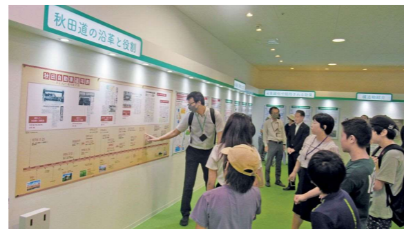
秋田道4車線化PRルーム(イオンスーパーセンター横手南店 2F専門店街)