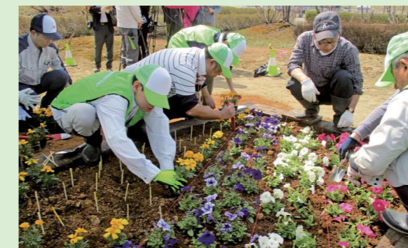
高福連携活動（花壇整備の様子）

高速道路と福祉が連携して幸福を広げていく「高福連携」は、高速道路の環境美化作業などを障がいのある方と協働し、地域社会の活性化に貢献することを目指した取組みです。