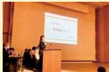
成果を発表する当社社員

事業構想大学院大学 仙台の「産学共創」を活かしたプロジェクト研究を通じた人材育成を推進し、地域の課題解決につながる事業の構築や計画を策定することで、地域経済の活性化に貢献しています。研究は、10カ月前後をかけて、多彩な講師の登壇やカリキュラムを受講しながら、新たな事業を構想し、その成果を発表します。