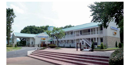
E-NEXCO LODGE 佐野SA店 (東北道 佐野SA)