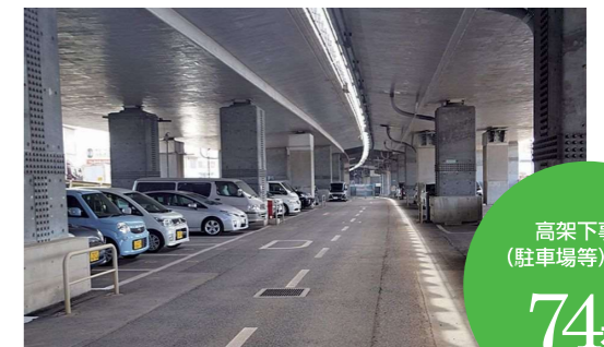
東北道 岩槻高架下駐車場