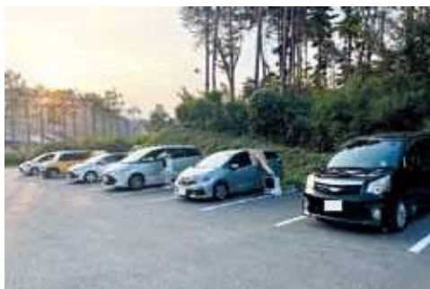
車中泊キャンプの様子

常磐道 南相馬鹿島SA外駐車場に17人が宿泊(普通車15台と移動式住居を配置)した実証実験で、車中泊の課題抽出や夏の暑さ対策などの検証を進めました。