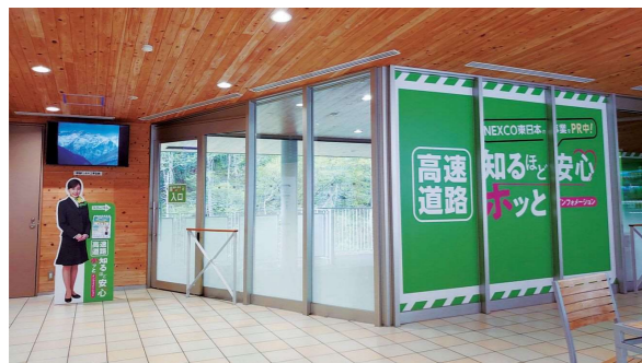
高速道路 知るほど安心ホットインフォメーション(関越道 谷川岳PA(下り線))

高速道路の機能強化やリニューアルプロジェクトを円滑に進めるためには、地域の皆さまやお客さまのご理解・ご協力が不可欠です。現場近くやショッピングセンターへのPRルームの設置、現場見学会を通して、整備効果・工事概要などを紹介しています。