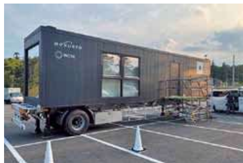
暑さ避難用に設置した移動式住居