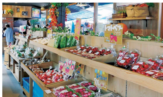
地域の青果類を販売（関越道 赤城高原SA上り線）