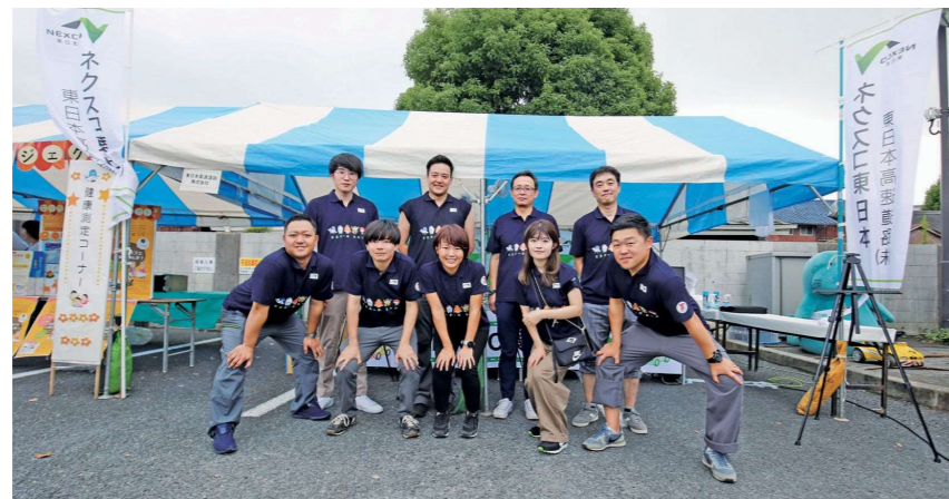
成田伝統芸能まつりへの出展

地域のイベント等へ出展して地域の皆さまとの交流を図ったり、事業について知っていただく機会を設けています。