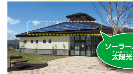
▲太陽の光から電気をつくるソーラーパネルを、高速道路のいろいろなところに設置しているよ