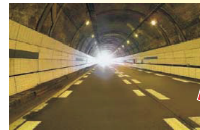
▲ナトリウムランプの照明

ナトリウムランプが使われているトンネルの古い照明を、電気の消費を減らせて寿命も長いLED照明に交換しているよ。