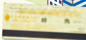
つうこうけん 通行券

イーティーシー とお くるま せんよう きかい イーティーシーやさいき せっち ETCレーンを通るためには、車に専用の機械(ETC車載機)の設置と イーティーシー ひつよう ETCカードが必要なんだよ。みんなのおうちの車には ついてるかな？ おうちのひと きに聞いてみよう！