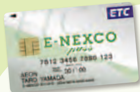
イーティーシー ETCカード

りようきんじょ いりぐち じどうはっけんき 料金所には、入口で自動発券機から 通行券を受け取り、出口料金所で しゅうじゅいん つうこうけん わた かね 収受員さんに通行券を渡してお金 を払う「一般レーン」と、入口も出口 も電波で通信してノンストップで 通行料金を支払える「ETCレーン」が あるよ。ETCレーンは道路が青色に なっていることが多いんだよ。