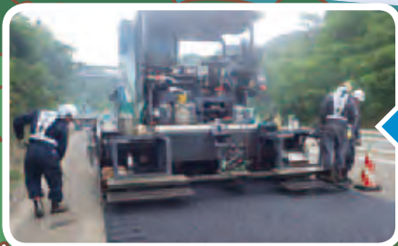
もう一度アスファルトを敷き直すよ