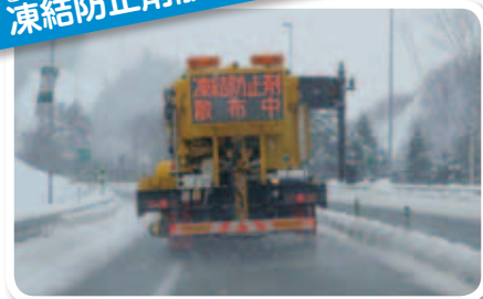
とうけつぼうしざいさんふしや 凍結防止剤散布車

道路が凍るのを防止する「凍結防止剤」を撒く車だよ。NEXCO東日本が一年に撒く凍結防止剤は15万トンにもなるんだ