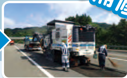
切削機という機械で アスファルトを削る