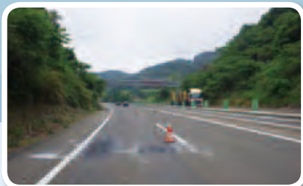
工事前のわだちがある道路

アスファルトでできている 道路は、たくさんの車が通る うちに、車の重みでへこんで “わだち”ができてしまうん だ。わだちを補修するには、 一度表面のアスファルトを 削って、もう一度アスファ ル舗装をしていくよ。