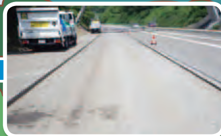
削った後の道路。削った場所がへこんでいるのが分かるかな？