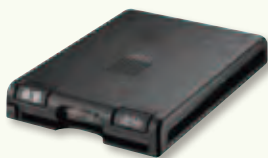
イーティーシー ETC車載機