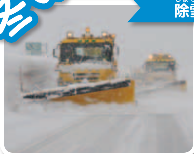
じよせつしゃ 除雪車