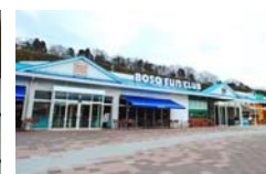
館山道 市原SA(下り線)