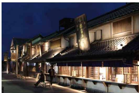
東北道 羽生PA(上り線)

東北自動車道羽生PA(上り線)が独自の世界観を演出する「テーマ型エリア」として平成 25 年 12 月 19 日に、常磐自動車道守谷SA(上り線)が“道ナカ”商業施設「Pasar」として平成 26 年 3 月 19 日にオープンしました。また、館山自動車道市原SA(下り線)及び長野自動車道姨捨SA(上り線)が地域性・旅の楽しみを凝縮した旅のドラマを演出する「ドラマチックエリア」として、それぞれ平成 26 年 3 月 26 日及び平成 26 年 3 月 29 日にオープンしました。