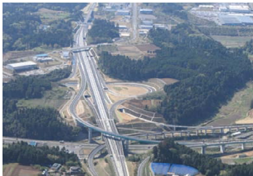
圏央道 東金 JCT

首都圏中央連絡自動車道(圏央道) 東金(とうがね)JCT～木更津東(きさらづひがし)IC 間(42.9km)が平成 25 年 4 月 27 日に、また、仙台北部道路 全線・富谷(とみや)IC が平成 25 年 12 月 22 日に開通しました。