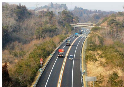
常磐道 広野 IC～常磐富岡 IC