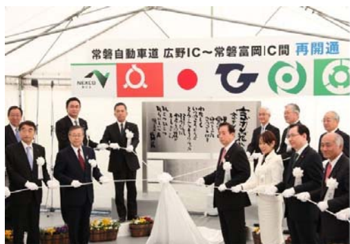
記念プレート除幕セレモニー

常磐自動車道(常磐道) 広野(ひろの)IC～常磐富岡(じょうばんとみおか)IC 間について、復旧工事が終了し平成 26 年 2 月 22 日に再開通しました。