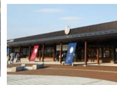
長野道 姨捨SA(上り線)