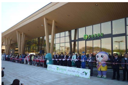
常磐道 守谷SA(上り線)