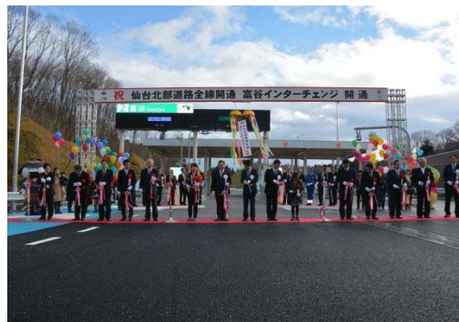
仙台北部道路 富谷 IC 開通式