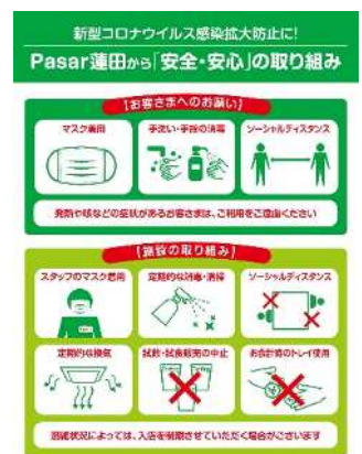
▲Pasar連田での取り組みポスター