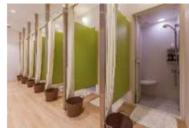
汗をかいたら快適なシャワー設備でさっぱり