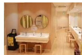
女性も安心、お化粧直しをできるスペースも