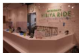
有人管理で大事な自転車も安心