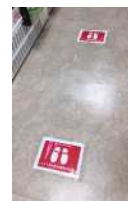
▲ソーシャルディスタンスの確保に向けた対策