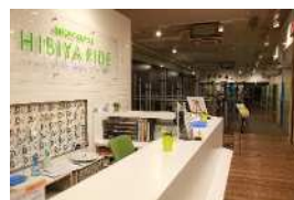
清潔なエントランス

前室付きの快適なシャワー設備を完備。また、広めのロッカールームで、ゆったりと着替えることができるため、通勤前に汗を流してさわやかに出勤できます。