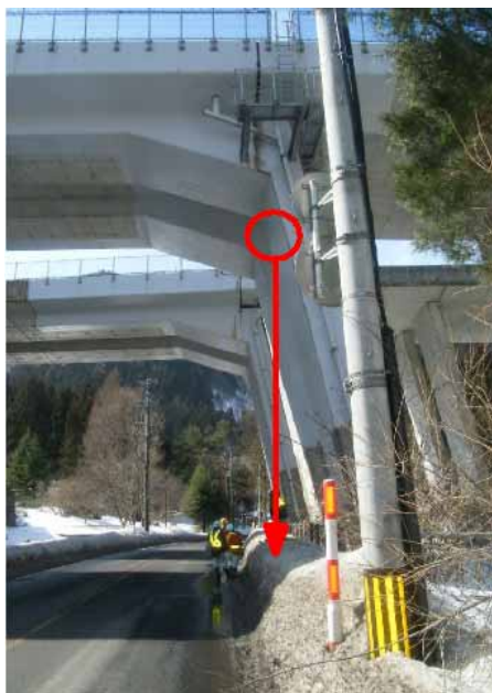
コンクリート剥離箇所