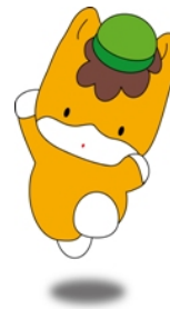
ぐんまちゃん(群馬県)