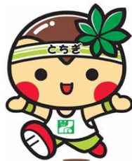
とちまるくん(栃木県)