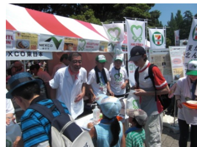
「東北六魂祭」での実施状況

(社)超人シェフ倶楽部の有名シェフが参加し、被災地の食材を使用したメニューの販売イベントを実施します。