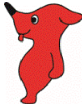
チーバくん(千葉県)