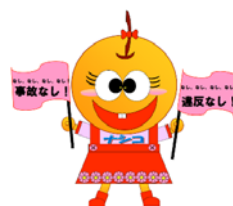
幸水ナシコ(NEXCO 東日本)