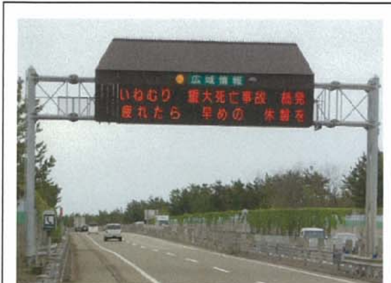
いねむり・重大事故続発について安全啓発