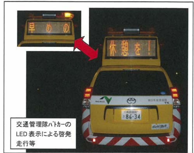
交通管理隊ハトカーのLED表示による啓発走行等