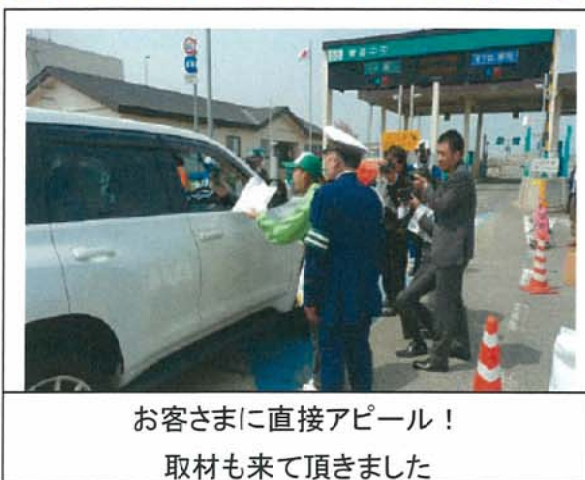
お客さまに直接アピール! 取材も来て頂きました