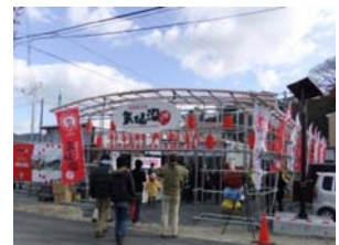
復興屋台村気仙沼横丁