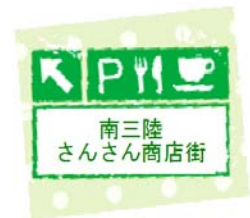
スタンプイメージ