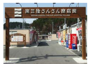
南三陸さんさん商店街