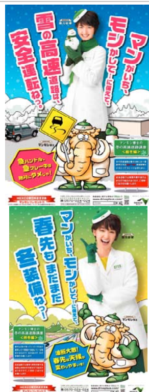
ポスター(厳冬期・終冬期)