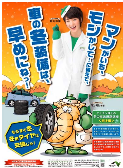
ポスター(初冬期)北海道・東北・新潟版