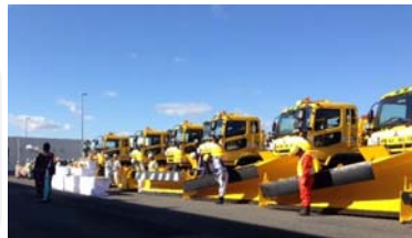
▲ 札幌管理事務所の雪氷出動式 (10/18)

関係者が作業・交通の安全について祈願するとともに、雪氷対策作業の開始を広くお知らせすることを目的として、各管理事務所にて実施しています