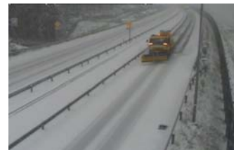
▲ 道央自動車道 トナムIC～十勝清水IC間 道路状況 (10/16)

関係者が作業・交通の安全について祈願するとともに、雪氷対策作業の開始を広くお知らせすることを目的として、各管理事務所にて実施しています