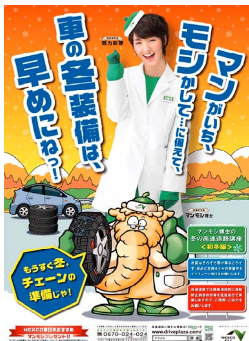
ポスター(初冬期)関東版