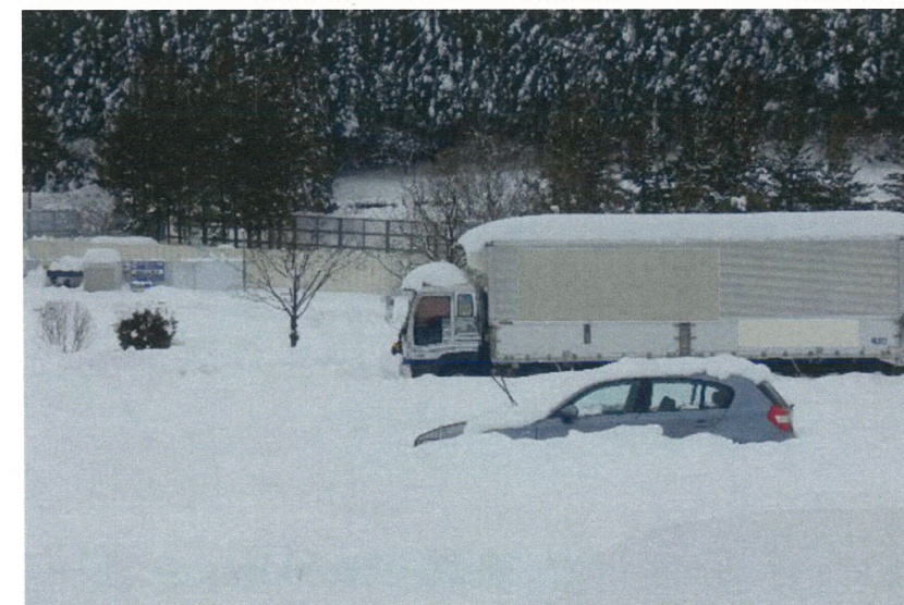
休憩施設における積雪状況（撮影箇所⑤：上信越道 横川ISA下り線）