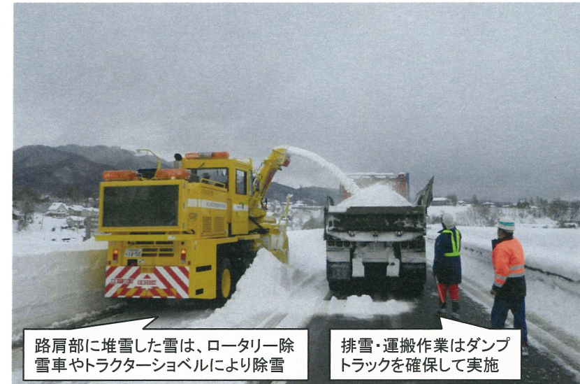
路肩部に堆雪した雪は、ロータリー除雪車やトラクターショベルにより除雪