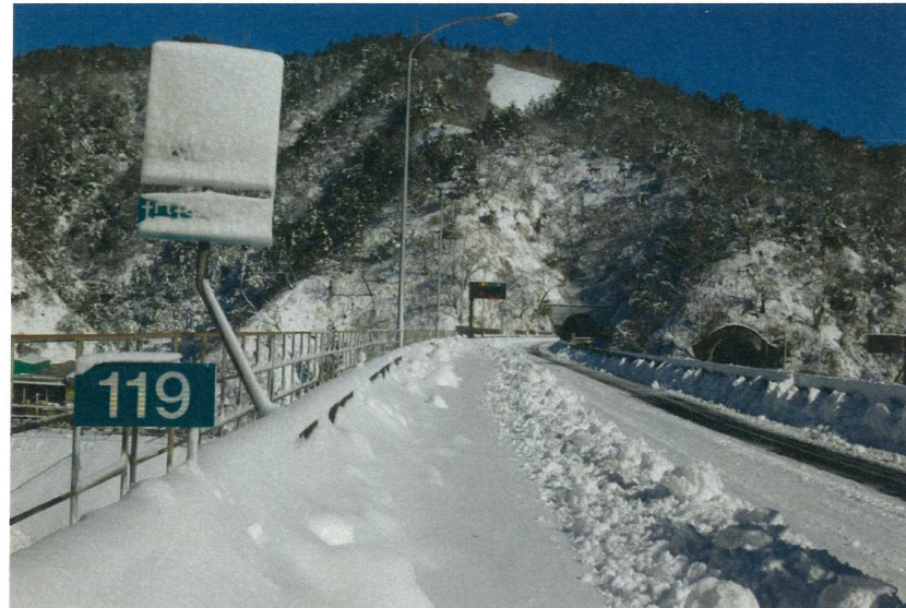
本線の積雪状況（撮影箇所①：常磐道 日立中央IC～日立北IC）