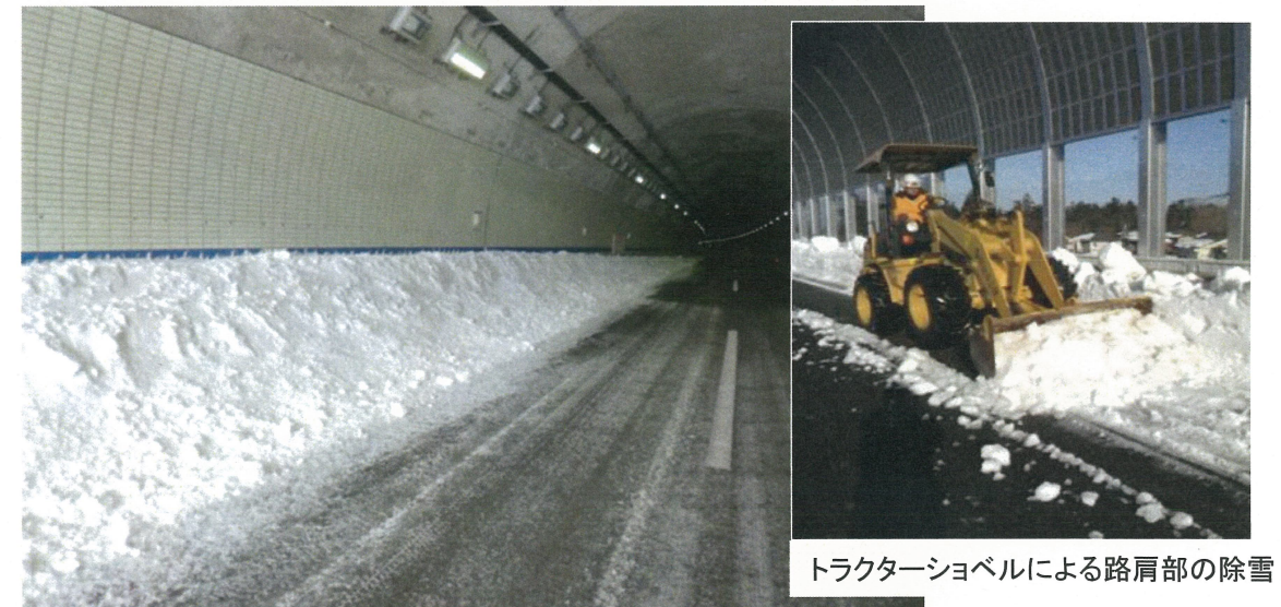
トラクターショベルによる路肩部の除雪