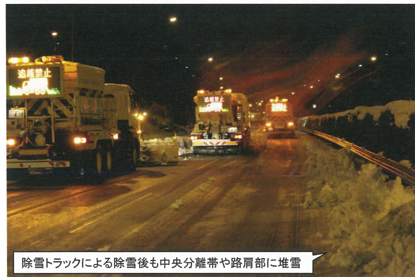
除雪トラックによる除雪後も中央分離帯や路肩部に堆雪