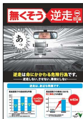
ポスター・チラシ