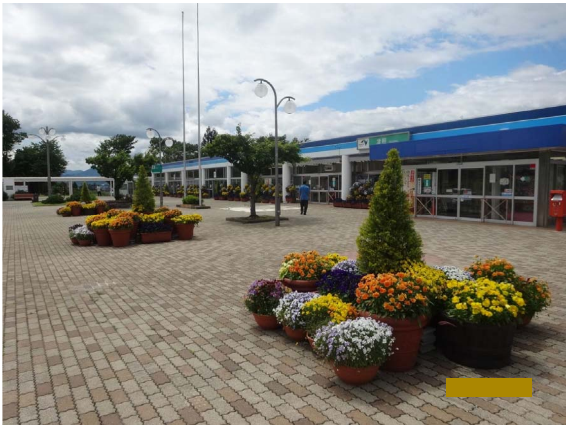
東北道 津軽SA(下り線)