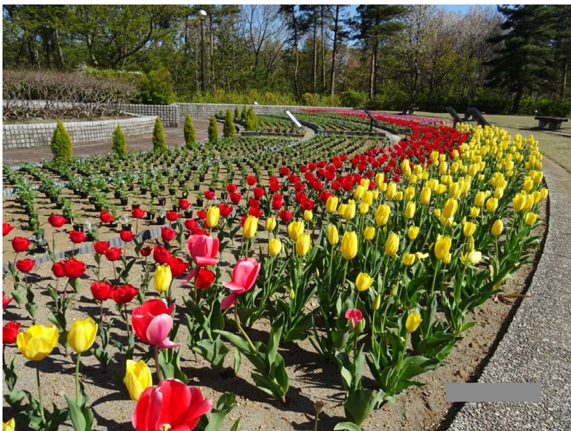
北陸道 米山SA(上り線)