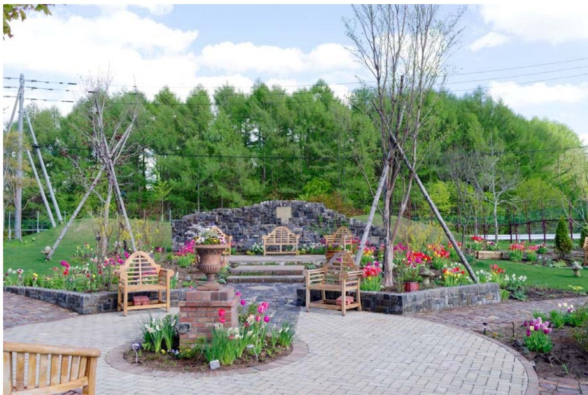
道央道 岩見沢SA(上り線)