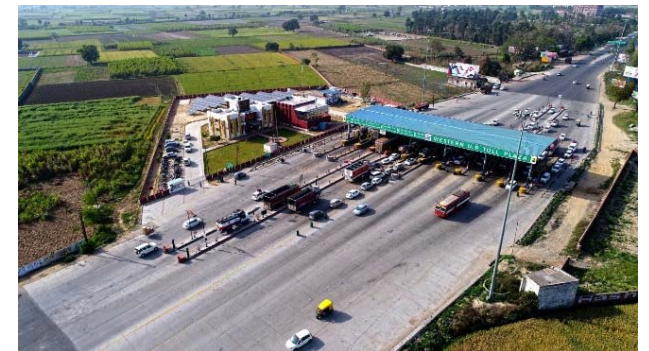
③ Western UP Tollways