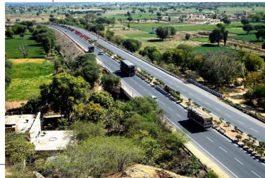
① Jaipur Mahua Tollways