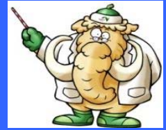
雪道研究家 マンモシ博士

お客さまに冬の高速道路を安全に走行していただくため、「マンモシ博士の冬の高速道路講座」を開講し、雪道キャンペーンの実施、除雪作業等の取り組み、冬用タイヤの装着や冬道の安全走行をお知らせしています。