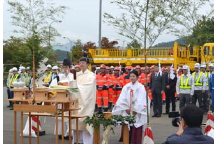
▲山形管理事務所の雪氷出動式(10/17)

雪氷対策作業に従事する関係者が作業・交通の安全について祈願するとともに、雪氷対策作業の開始を広くお知らせすることを目的として、各管理事務所で開催しています。